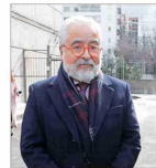
El abogado declara como imputado en el caso Audio. Diligencia continuará hoy.