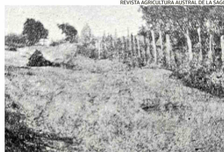
REVISTA AGRICULTURA AUSTRAL DE LA SAGO