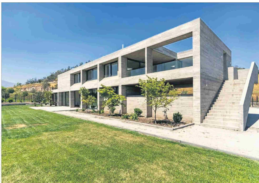
Las líneas puras y el material de construcción a la vista es un sello del arquitecto que diseñó la casa.

La rebaja es de más de $150.000.000. La vivienda tiene terminaciones de alto nivel y se encuentra en un terreno de 3.500 metros cuadrados.