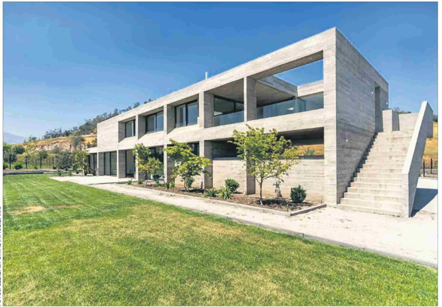
Las líneas puras y el material de construcción a la vista es un sello del arquitecto que diseñó la casa.

La rebaja es de más de $150.000.000. La vivienda tiene terminaciones de alto nivel y se encuentra en un terreno de 3.500 metros cuadrados.