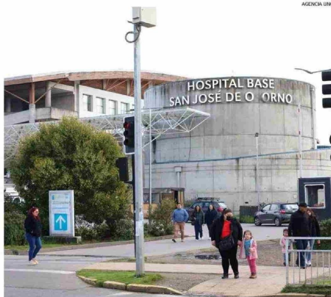
LA CONTRALORÍA DETECTÓ IRREGULARIDADES EN LAS LISTAS DE ESPERA DEL HOSPITAL DE OSORNO.