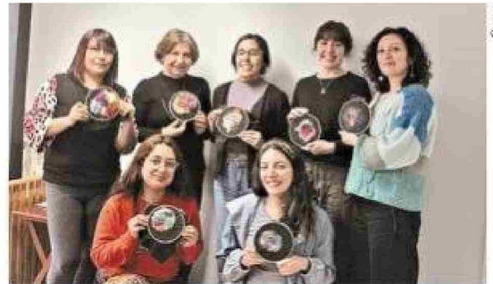
Registro de un anterior taller "Astronómico Textil".