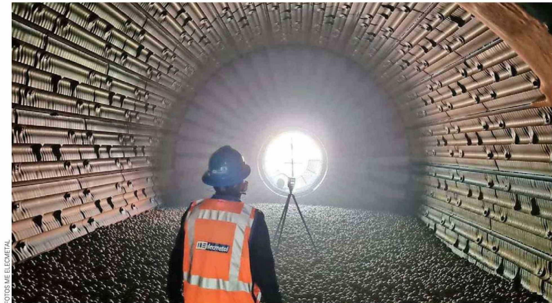
Entre la oferta de productos y servicios que ME Elecmetal posee destacan las bolas de acero para la molienda.

En la búsqueda por entregar siempre las mejores soluciones a sus clientes, la empresa incluye dentro de sus servicios integrales de chancado el suministro de repuestos para equipos de trituración, ofreciendo una amplia gama para trituradoras de cono, giratorias y mandíbulas. Esto posibilita a sus clientes acceder a repuestos de alta calidad para todas las máquinas de trituración del mercado de minería, desarrollados con ingeniería propia y diseñados bajo los estándares y certificaciones exigidas por los fabricantes de equipos,