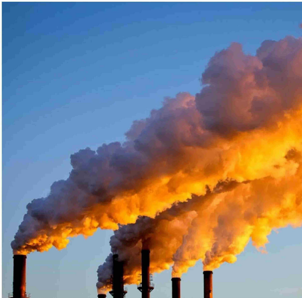
► Otro de los campos donde Chile no sale bien parado es en el cuidado de la biodiversidad.