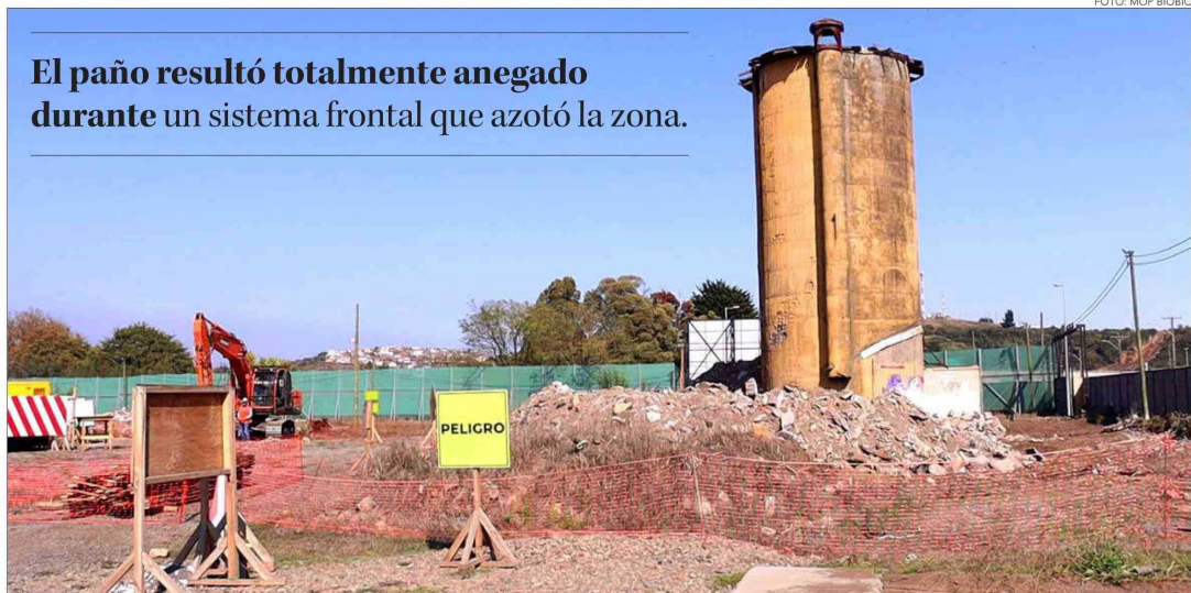
El paño resultó totalmente anegado durante un sistema frontal que azotó la zona.

Twitter @DiarioConcepcion contacto@diarioconcepcion.cl