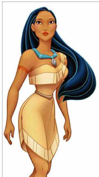
Los expertos calcularon que el salto al vacío de Pocahontas fue desde una altura de 252 metros lo que, al menos, pudo producirle múltiples fracturas.