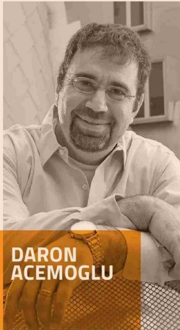
PREMIO NOBEL DE ECONOMÍA 2024 Y PROFESOR DE ECONOMÍA EN EL MIT. ES COAUTOR (JUNTO CON SIMON JOHNSON) DE POWER AND PROGRESS: OUR THOUSAND-YEAR STRUGGLE OVER TECHNOLOGY AND PROSPERITY (PUBLIC AFFAIRS, 2023).