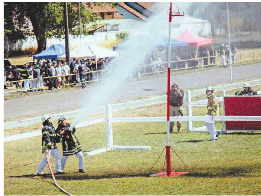
El campo de entrenamiento aún no se define, pero se gestiona con Bienes Nacionales.