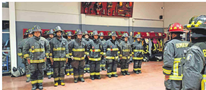
De manera progresiva, el Cuerpo de Bomberos de Hualpén espera que todos sus voluntarios puedan capacitarse en Estados Unidos.