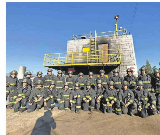
Diez compañías componen el Cuerpo de Bomberos de Talcahuano.

Esta iniciativa, que comenzó en mayo, es comandada por una empresa externa y se espera que ayude, por ejemplo, a robustecer los servicios que entregan sus compañías, las condiciones de los bomberos o aspectos de capacitación y formación que, tal vez, no estaban hasta ahora en la órbita, "como el trabajo con los niños con autismo, características mentales, sordomudos (...)