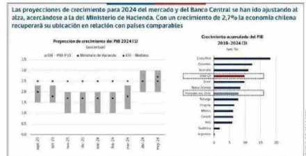
Página 11 de la presentación del ministro de Hacienda, Mario Marcel, el 6 de junio de 2024, en seminario de la Sofía, donde dice que las proyecciones de esa cartera han sido más acertadas que el Banco Central y el mercado.

"Es cierto que la política fiscal se guía a partir de la regla del balance