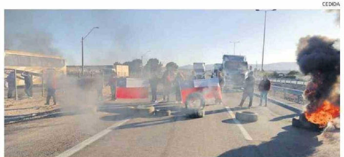
LOS PESCADORES ASEGURARON QUE PODRÍAN VOLVER A TOMARSE LOS CAMINOS.

Quizá a la Asamblea General de 2030, desde Atacama vaya una delegación de científicos que pudieran cumplir su anhelo de formación e investigación astronómica íntegramente en la región.