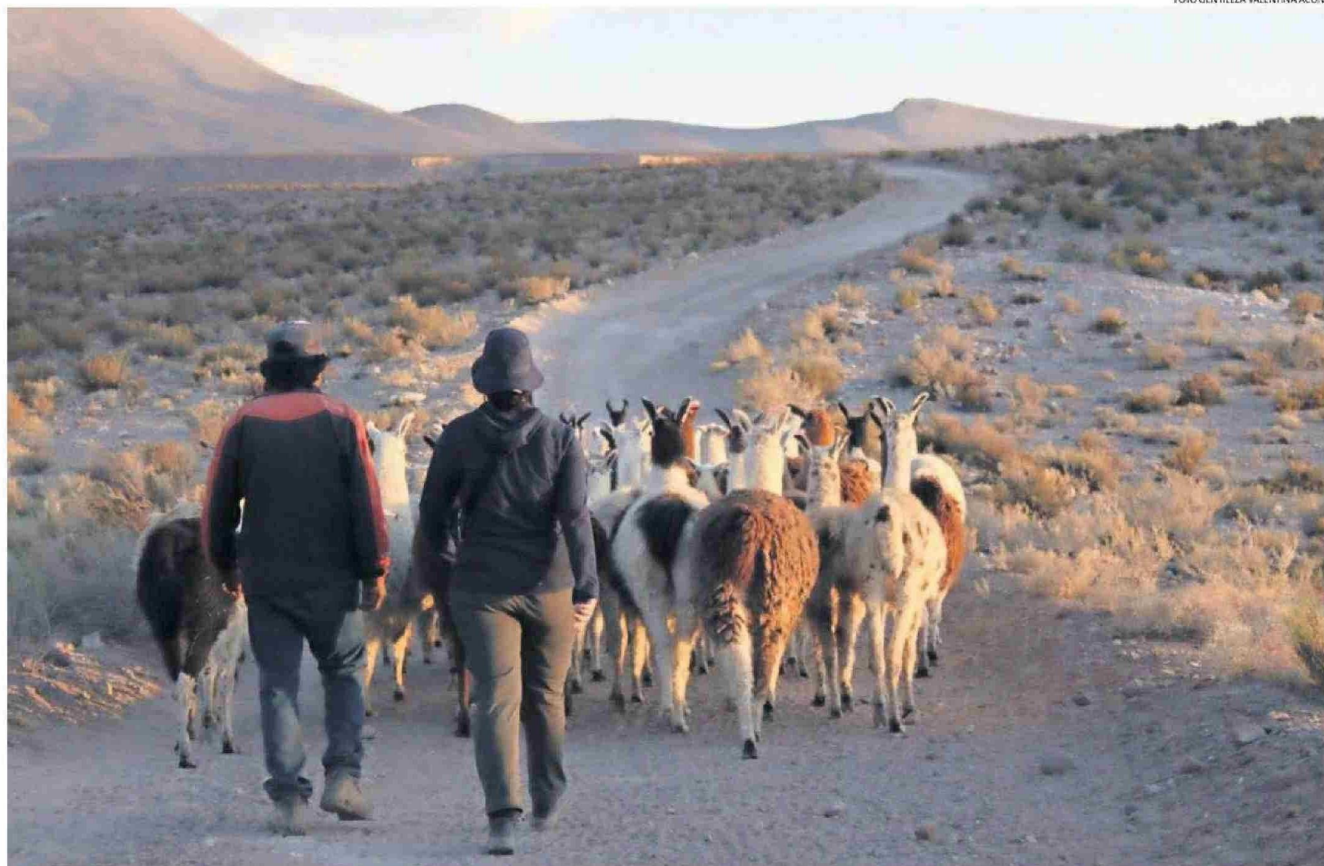
VAN 45 MUERTES DE LLAMAS, PRODUCTO DE LOS ATAQUES DE LOS PUMAS, REGISTRA LA COMUNIDAD DE CASPANA.