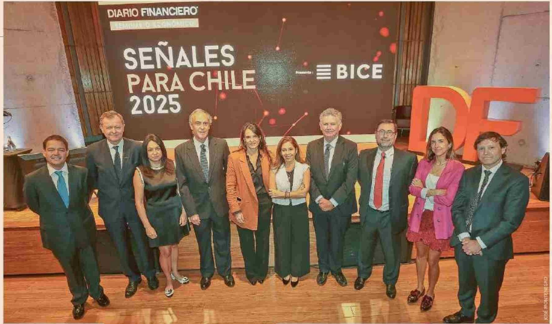
Los protagonistas del encuentro "Señales para Chile 2025".

"Tenemos desafíos que aunque estemos en estas circunstancias, en particular en un año electoral, no podemos soslayar. Todas estas cosas que he planteado acá requieren acuerdos políticos, requieren que hagamos transformaciones que tienen que tener iniciativa de la política", cerró Repetto.