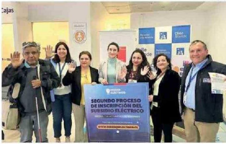
AUTORIDADES HICIERON EL LLAMADO A POSTULAR AL SUBSIDIO.

El plazo final para postular al beneficio es hasta el 6 de noviembre en www.subsidioelectrico.cl