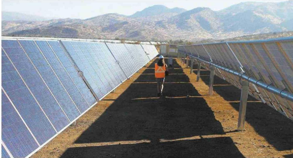
LA PRODUCCIÓN DE ENERGÍA AUMENTÓ EN LA REGIÓN, IMPULSADA POR NUEVAS PLANTAS ELÉCTRICAS Y DESACOPADA DE LA BAJA DEL PIB.