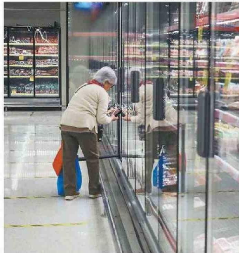
MIENTRA EL PIB REGIONAL BAJÓ EL CONSUMO DE LOS HOGARES SUBIÓ.

“Atacama depende del cobre mucho más que el promedio del país, es la región clave que depende del cobre, mucho más que las otras regiones de Chile y eso hace que tengamos estos ciclos muy volátiles de alzas muy grandes o disminuciones muy grandes, como en este caso”, cerró el econo-