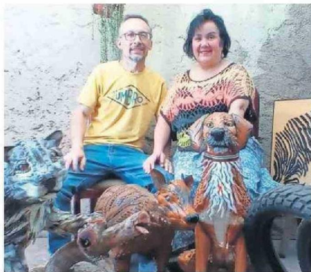
EL MATRIMONIO CONFECCIONA TODO EN EL PATIO DE SU CASA.

clata que fueron recogidos en la calle produjeron garzas y loros, que terminaron adornando el mismo predio. Las felicitaciones motivaron al matrimonio a ir por algo más desafiante: hacer un tiburón a escala real. La imagen de la escultura que subieron a sus redes sociales fue compartida y comentada por cientos de usuarios.