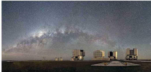
VLT DE CERRO PARANAL HA SIDO PROTAGONISTA DE GRANDES HALLAZGOS CIENTÍFICOS.