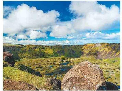
VOLCÁN RANO KAU TIENE DE 900 MIL A 100 MIL AÑOS DE ANTIGÜEDAD.