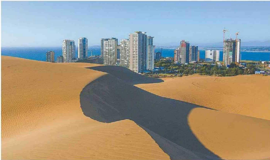
DUNAS DE CONCÓN: AL SER UN CAMPO DE DUNAS FÓSILES SON UNA GEOFORMA NATURAL EXTREMADAMENTE FRÁGIL