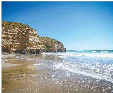
EN LA BASE DEL ACANTILADO DE QUIRILLUCA HAY DOS CAVERNAS.

En el caso particular de la Región de Valparaíso,