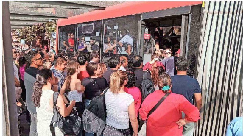
Saturación. A las afueras de estaciones del metro de mayor concurrencia, como Tobalaba (en la foto) o Baquedano, se produjo la principal aglomeración de pasajeros.