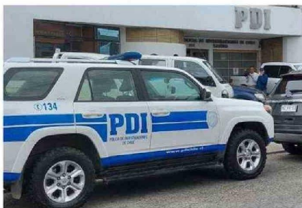
LOS DETECTIVES CON BASE EN CASTRO ACUDIERON AL LUGAR.

“ El cuerpo permanecía a unos 200 metros de costa, enredado en una línea de cultivo de choritos”.