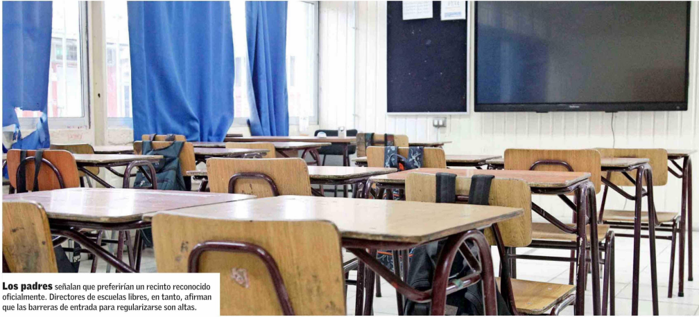
Los padres señalan que preferirían un recinto reconocido oficialmente. Directores de escuelas libres, en tanto, afirman que las barreras de entrada para regularizarse son altas.