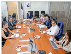
Por casi dos horas sesionó la instancia, compuesta por seis autoridades que sustituyeron a los titulares.

"Subrogantes" de ministros Comité del Gobierno vota nuevamente en contra de Dominga: uno de sus integrantes ya se había opuesto al proyecto minero