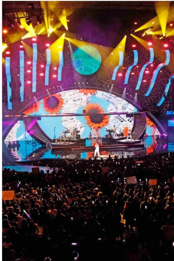
► La organización del Festival de Viña no se ha referido sobre las críticas del tema.