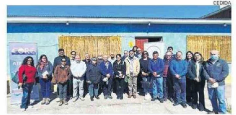
REUNIÓN CONTÓ CON LA ASISTENCIA DE DIVERSOS ACTORES.