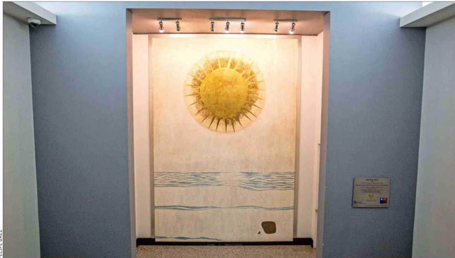
"SOL" Y "LUNA".—Los murales enfrentados son los únicos que han sido restaurados y hoy están en buen estado.

El contraste lo dan los otros dos de la serie "Sol" y "Luna". Pintados en el entonces Cine