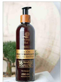
Loción multipropósito de algas marinas, el producto central de Marina Vital.