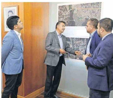
Las definiciones son parte de la Mesa Más Movilidad, integrada por diversas autoridades y representantes.

"El muro de pantalla no está funcionando y tampoco el contrato de mantenimiento. Esto es muy relevante, porque la unidad facilita y coordina el funcionamiento de los semáforos", señaló. Frente a lo anterior, reveló que "tomamos la decisión de financiar la reparación y mantenimiento de esos puntos para que estén habilitados a la brevedad posible, para que enfrenten la crisis de conectividad que vamos a vivir".