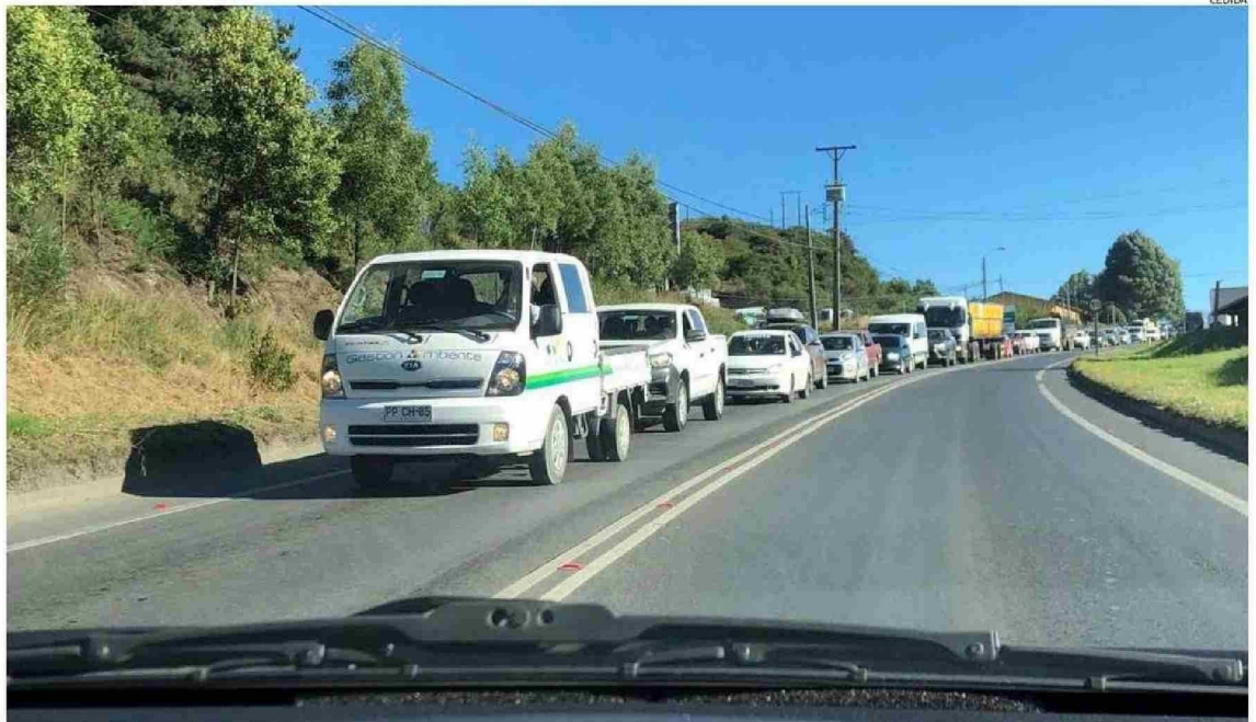
LA DOBLE VÍA CHILOTA AYUDARÁ A DESCONGESTIONAR LA RUTA 5, QUE EXPERIMENTA FRECUENTES ATOCHAMIENTOS, ESPECIALMENTE EN LA TEMPORADA DE VERANO.

El tramo Chacao-Chonchi fue ratificado por el Presidente Gabriel Boric durante su gira de tres días en enero de 2024, reafirmando la importancia de la continuidad de la Ruta 5 de alto estándar para conectar al país desde Arica hasta la ciudad quellonina el año 2033. Se pretende invertir al menos unos 655 millones de dólares