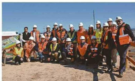
REPRESENTANTES DE AGUAS PACÍFICO Y ACADES HICIERON RECORRIDO POR OBRAS EN EJECUCIÓN.

Durante el periodo de construcción, la planta desalinizadora de Aguas Pacífico representa, además, una fuente de dinamismo económico para la zona, aportando hoy más de 1.500 puestos de trabajo, donde el 30% es mano de obra regional y local. CS