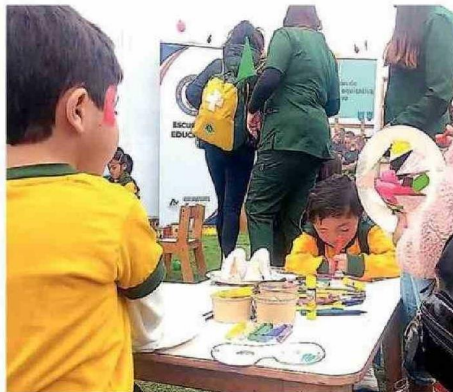
LO MEJOR ES IR A ACTIVIDADES AL AIRE LIBRE.

Una de las primeras recomendaciones que entregó a los padres es privilegiar actividades en espacios al aire libre, como plazas o parques. “Pero sabemos que eso no es posible siempre, por lo cual tene-