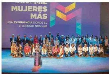
Al cierre de la cumbre, la cantante lírica Maxiel Marchant.