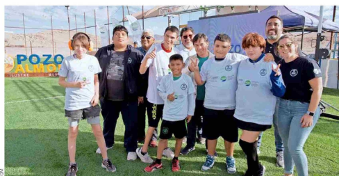
Actividades deportivas junto a la Fundación Miradas Compartidas.

SQM Yodo Nutrición Vegetal está comprometida con la preservación del legado cultural de Tarapacá y Antofagasta. A lo largo de los años, la empresa ha trabajado con instituciones como la Corporación Museo del Salitre de Humberto y Santa Laura, y la Corporación Museo del Salitre de Chacabuco, contribuyendo con recursos, experiencia y liderando sus directores. Como herederos de la industria del salitre, la compañía impulsa proyectos para conservar sitios históricos y proteger vestigios arqueológicos cercanos a sus operaciones. Este compromiso con la historia y la cultura refuerza su propósito de transformar recursos en progreso, promoviendo el desarrollo sostenible y la conservación del patrimonio. Con cada paso dado en 2024, SQM Yodo Nutrición Vegetal ha demostrado que su propósito no es solo un enunciado, sino una guía tangible que impulsa proyectos concretos, transforma comunidades y contribuye al desarrollo sostenible, reafirmando su posición como un actor clave en industrias como la salud, la alimentación y la tecnología, transformando recursos en vida y progreso.