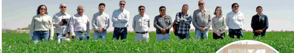
Centro Productivo de Alfalfa "El Carmelo".

E l 2024 fue un año de grandes avances para SQM Yodo Nutrición Vegetal, una empresa que reafirmó su compromiso con el desarrollo sostenible de la compañía, los territorios y el país. Desde el lanzamiento de su inspirador propósito — "Desarrollar capacidades únicas que transforman recursos en vida y progreso" — hasta la ejecución de iniciativas que impactaron positivamente a miles de personas, la compañía demostró su compromiso con el desarrollo sostenible tanto del país como de los territorios en los que está presente.