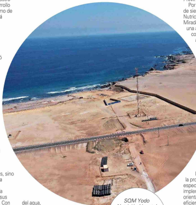
SQM Yodo Nutrición Vegetal reafirma su compromiso con la sostenibilidad con una moderna planta fotovoltaica.

El año que acaba de finalizar, SQM Yodo Nutrición Vegetal fortaleció su compromiso con el desarrollo sostenible de la compañía, los territorios y el país, a través del lanzamiento de su propósito y la implementación de iniciativas que generaron valor social compartido en áreas como la agricultura, innovación, emprendimiento, sostenibilidad, inclusión y bienestar.