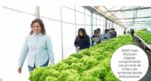
SQM Yodo Nutrición Vegetal, comprometido con el norte de Chile y los territorios donde está presente.