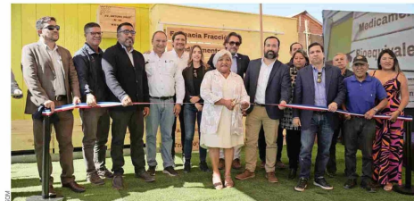
SQM Yodo Nutrición Vegetal, la Farmacia Fracción y la Municipalidad de Huala inauguraron la primera sucursal farmacéutica en la capital comunal.

Basados en el compromiso constante con el desarrollo sostenible de los territorios y sus comunidades, SQM Yodo Nutrición Vegetal, la Farmacia Fracción y la Municipalidad de Huala inauguraron la primera sucursal farmacéutica en la capital comunal, un hito que representó una gran oportunidad para mejorar el acceso a medicamentos para cientos de familias del territorio y que se enmarca en el convenio que la compañía mantiene con la Fundación para la Superación de la Pobreza (FSP). Cerca de 200 personas participaron en la ceremonia de apertura de la primera sucursal de Farmacia Fracción, que brindará acceso a medicamentos a más de 27.000 personas de la comuna y la