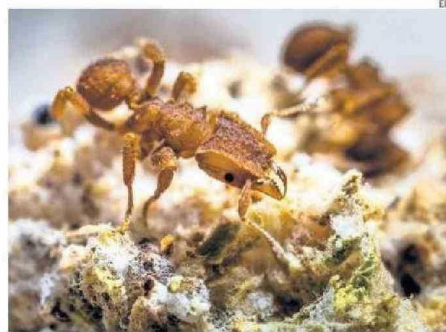
ESPECIE DE HORMIGA RECOLECTORA DE HONGOS ATTA CEPHALOTES.

gos con base en los cuatro sistemas agrícolas que utilizan.