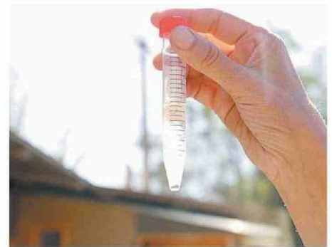
LLAMAN A EVITAR LOS ESPACIOS CON AGUA ESTANCADA.

"El Aedes aegypti puede adquirir el virus al picar a alguien con dengue importado, y posteriormente transmitirlo a una persona sana mediante una picadura. Por eso es fundamental el trabajo