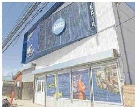
El último local inaugurado el 3 de enero del 2024 por Ferreteria Mic.

"Acá se ve de todo. Desde la persona que viene a comprar un tornillo hasta las personas que andan buscando materiales de construcción o las que vienen