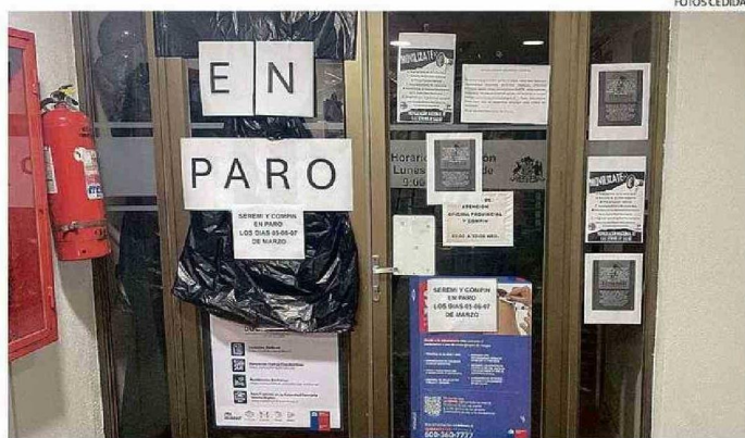
EN LA TORRE BIOCEÁNICA ESTA LA OFICINA PROVINCIAL QUE ESTÁ CERRADA POR EL PARO.