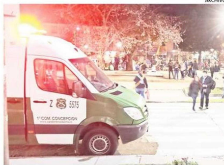
CARABINEROS REALIZANDO PATRULLAJES EN EL LUGAR.