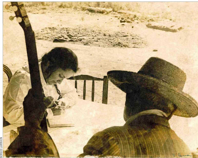
Violeta Parra en sus primeros viajes, aquí en Hualpi, retratada por Sergio Larraín.

El libro incluye un código QR desde donde se accede a las grabaciones de las cuatro tonadas, tres por Violeta Parra, además de las antitonadas para guitarra clásica, que además llegarán al disco el próximo año.