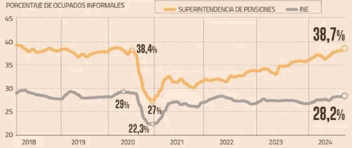
TASAS DE INFORMALIDAD LABORAL