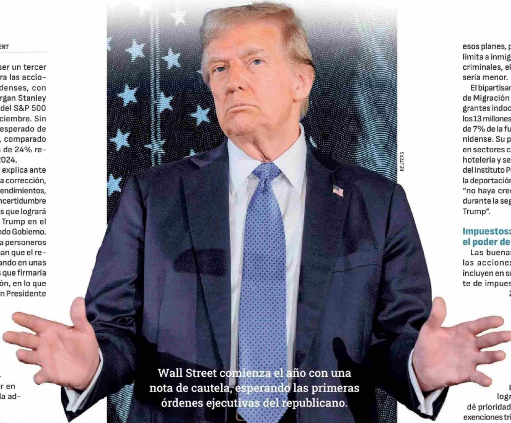
Wall Street comienza el año con una nota de cautela, esperando las primeras órdenes ejecutivas del republicano.