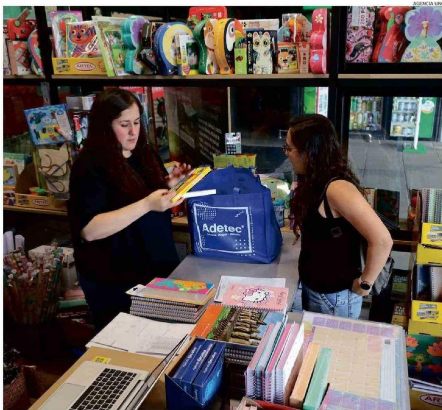
EN LA LIBRERÍA DIGITALOFI ESTÁN PREPARANDO TODOS LOS DÍAS LAS BOLSAS CON LOS PRODUCTOS DE LAS LISTAS.

"Hemos revisado entre 10 y 15 productos que son los que más se piden y hay diferencias, y los clientes lo dicen. Nosotros estamos comprando directamente al productor, no pasamos por intermediarios, por eso tenemos buenos precios. Ahora todo el mundo cotiza, ya no es como antes, que uno iba a un lugar y compraba; ahora se cuida más el presupuesto", comentó.