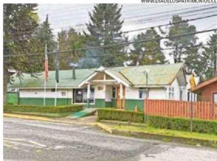
WWW.DIADELOSPATRIMONIOS.CL VISITA A LA 5ª COMISARÍA DE CARABINEROS PANGLILIPULL, MAÑANA, 10:00 HORAS.

El proyecto es del Colegio de Arquitectos Delegación Zonal Los Ríos con participación de estudiantes de la carrera de Arquitectura de la Universidad Austral de Chile. ☞