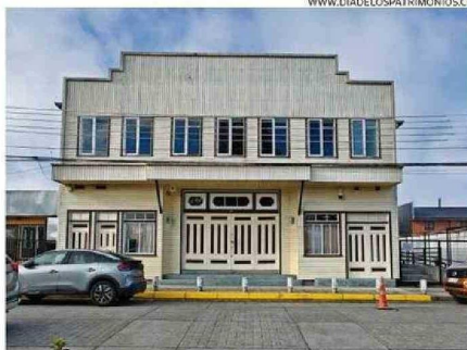
WWW.DIADELOSPATRIMONIOS.CL EL TEATRO GALIA DE LANCO ABRIRÁ HOY MAÑANA A LAS 10:00 HORAS.