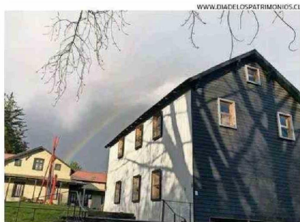
WWW.DIADELOSPATRIMONIOS.CL EL MUSEO MOLINO LOS CHILCOS DE LA UNIÓN ABRE A LAS 11:00 HORAS HOY.