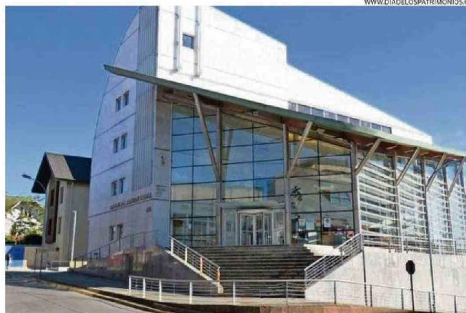
WWW.DIADELOSPATRIMONIOS.CL LA CORTE DE APELACIONES DE VALDIVIA SE PODRÁ VISITAR MAÑANA ENTRE LAS 09:00 Y 13:00 HORAS.

Y en San José de la Mariquina, a las 19:00 horas, específicamente en calle Alejo Carrillo N°1100 será el lanzamiento de la primera plataforma digital del patrimonio de Mariquina.