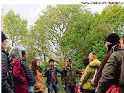
WWW.DIADELOSPATRIMONIOS.CL A LAS 10:30 HORAS DE HOY INICIA EL RECORRIDO GUIADO POR LA ISLA TEJA.