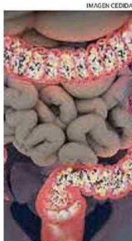
LOS CASOS DE ENFERMEADES INFLAMATORIAS INTESINALES VAN AL ALZA, CON 8 A 10 CASOS NUEVOS MENSUALES EN LA REGIÓN.