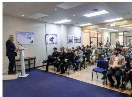
AL DÍA SIGUIENTE, DESPIDIÓ A LA EXPEDICIÓN ANTÁRTICA DEL INSTITUTO ANTÁRTICO DE CHILE.