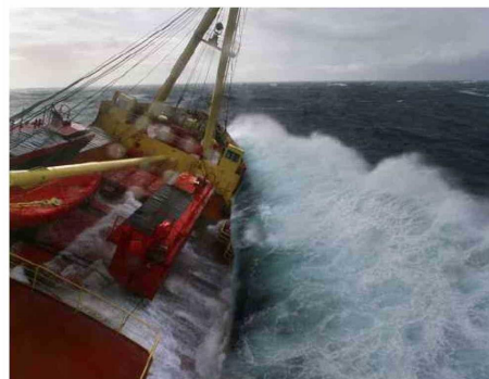
LA PLATAFORMA CONTINENTAL BAJO EL MAR DE DRAKE ES OBJETO DE CONTROVERSA ENTRE CHILE Y ARGENTINA.