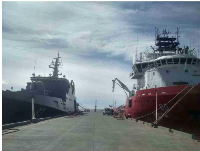
PODERÍO ANTÁRTICO: A LA IZQUIERDA EL PATRULLERO FUENTEALBA ATRACADO JUNTO AL NUEVO REMOLCADOR LIENTUR, EN PLENO ACONDICIONAMIENTO. PRONTO, SE LES UNIRÁ EL NUEVO ROMPEHIELOS ALMIRANTE VIEL, CONSTRUIDO EN CHILE.

50 mil millones de pesos proyecta invertir el Estado de Chile en infraestructura antártica.