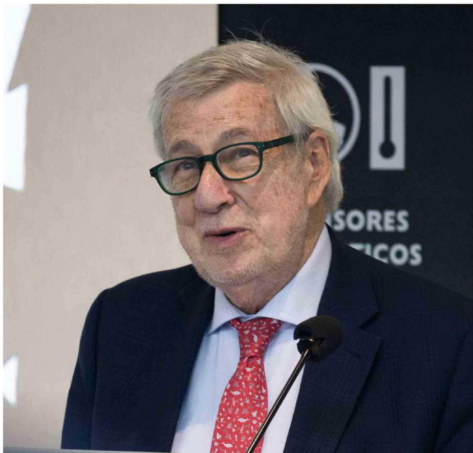
EL CANCELLER ALBERTO VAN KLAVEREEN AFIRMÓ QUE PUNTA ARENAS ES LA PUERTA DE ENTRADA A LA ANTÁRTICA Y OFRECE UN GRAN POTENCIAL PARA EL DESARROLLO DE ENERGÍAS VERDES EN BASE AL HIDRÓGENO.

Pedro Escobar A. pescobar@elpinguino.com