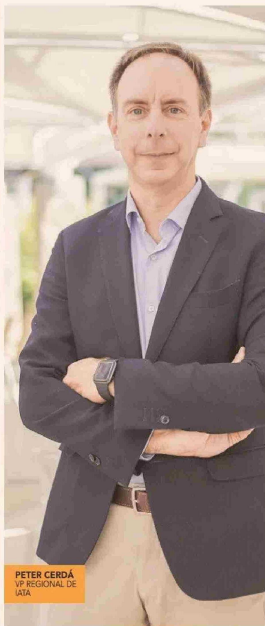
PETER CERDÁ VP REGIONAL DE IATA

"No es admisible que un pasajero llegue tres horas antes a un aeropuerto, y que para un vuelo doméstico tengas que llegar dos horas antes porque el proceso es muy lento", señaló Cerdá.