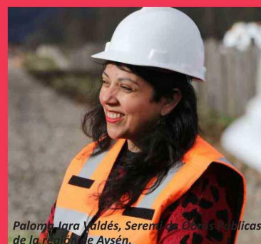
Paloma Jara Valdés, Seremi de Obras Públicas de la región de Aysén.

De esta manera, la labor tanto de los dirigentes/as y los trabajadores/as es muy valiosa, puesto que con su servicio, dedicación y trabajo, garantizan el acceso al agua potable en los diversos territorios rurales de la región de Aysén.