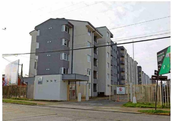
LA CCHC HA PROPUESTA UNA SERIE DE MEDIDAS PARA REACTIVAR EL SECTOR, COMO AMPLIAR LAS GARANTÍAS ESTATALES PARA LOS CRÉDITOS HIPOTECARIOS.