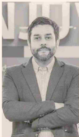
JUAN PABLO DUHALDE, DIRECTOR NACIONAL DEL INJUV.

Un dato llamativo es que los jóvenes ven la acción de cuidar "con distancia", es decir, que si bien muchos la desarrollan, no se reconocen como cuidadores y lo incorporan como una acción más bien de responsabilidad familiar.